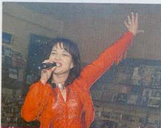
Всегда удивительная и неповторимая...