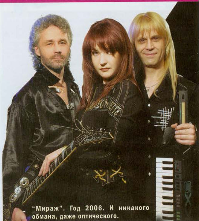
“Мираж”. Год 2006. И никакого обмана, даже оптического.

“ВОТ ЕСЛИ БЫ В РОССИИ СУЩЕСТВОВАЛИ ХОТЯ БЫ КАКИЕ-ТО НАЧАТКИ НАСТОЯЩЕЙ ИНДУСТРИИ ЗВУКОЗАПИСИ, ТО ЕСТЬ УПОРЯДОЧЕННАЯ БОРЬБА С ПИРАТСТВОМ, ВЫПЛАТА АВТОРСКИХ ОТЧИСЛЕНИЙ ЗА ПРОДАННЫЕ ЗВУКОВЫЕ НОСИТЕЛИ И ПОЯВЛЕНИЕ ПЕСЕН В ЭФИРЕ - ТОГДА КРИТИЧЕСКИМ ЗАМЕЧАНИЯМ ПРЕССЫ СТОИЛО БЫ УДЕЛЯТЬ ВНИМАНИЕ.”