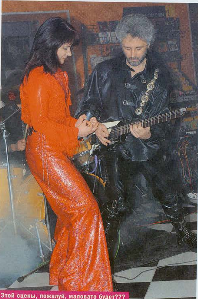
Этой сцены, пожалуй, маловато будет???