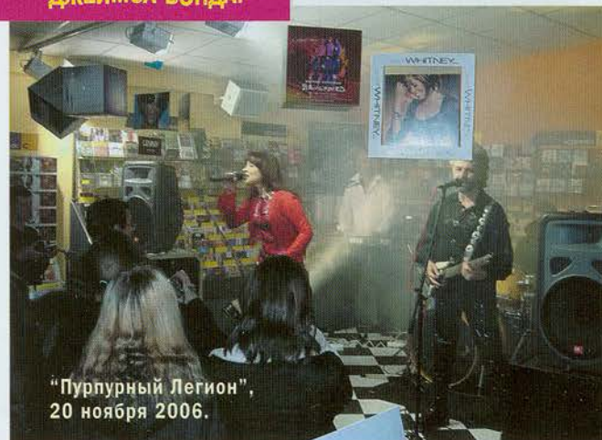
"Пурпурный Легион", 20 ноября 2006.

"ИМЯ "МИРАЖА" ПРИНАДЛЕЖИТ ИСТОРИИ В ТОЙ ЖЕ СТЕПЕНИ, ЧТО И ПЕРВЫЙ ФИЛЬМ ПРО ДЖЕЙМСА БОНДА."